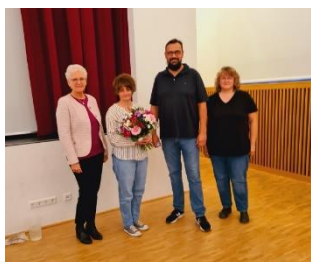
Abschied, Kontinuität und Neuanfang: Wahlen der Schulpflegschaft