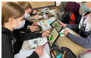
Digitalität erleben: iPad-Koffer ergänzen das BYOD-Konzept