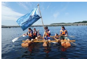
Gemeinsam auf dem See: Floßbauen der neuen Oberstufe