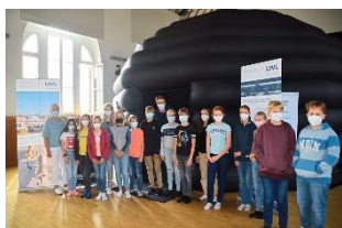
Nach den Sternen greifen: Das Pop-Up-Planetarium macht Station im Anton