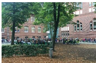
Neu am Anton: Wir begrüßen unsere neuen Fünftklässler_innen herzlich