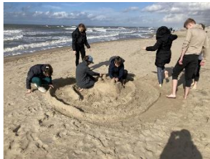
Endlich wieder die Welt entdecken: Cuxhaven-Fahrt der Klassen 6.