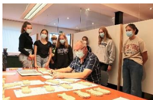
Die eigenen Talente weiter entdecken: Klassen 8 bei der Potenzialanalyse