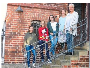
Erfolg beim Geschichtswettbewerb: Wir gratulieren herzlich!