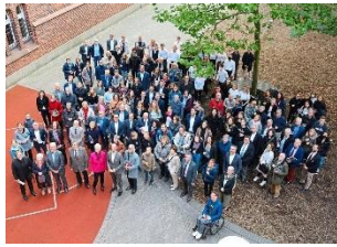
Gratulation zum 125. Geburtstag: Festgäste zum Schuljubiläum.