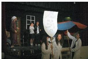
Ein unterhaltsamer Abend: Der Litera- turkurs präsentiert Molière