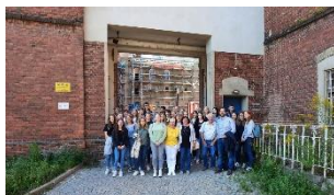
Geschichte aus erster Hand erleben: EF in Dresden